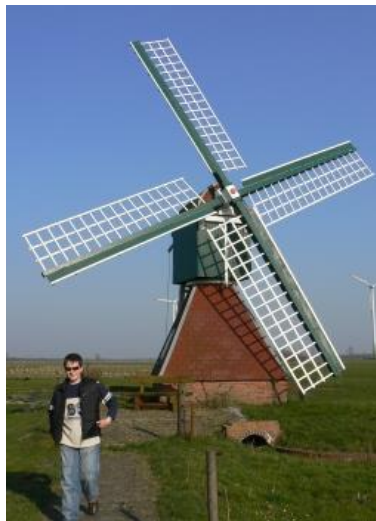
Kokerwindmühle in Leegmoor, 2007, Foto Dietrich Janßen, Emden

Von der Barkmühle gelangte man zum Petkumer Hammrich und zur Türkmühle (37). Auf Grovehörn stand eine große Mühle mit drei Schrauben (38). Nun zur Mühle am Waskemeer Nr. 39 Reemt Enninga. Sie war die einzige Wasserschopfmühle mit Windrose und Jalousieklappen. Sie bot als letzte Windmühle im