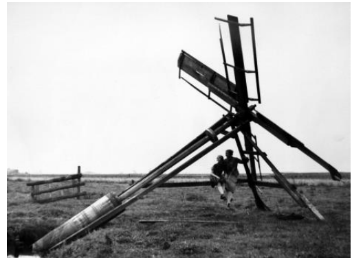
Flutter im Riepster Hammrich, 1939

In den Niederungsgebieten bei Riepe, und vor allem im Riepsterhammrich gab es früher etwa ab dem 18. Jh. Viele Wasserschöpfmühlen der verschiedensten Bauarten. Die meisten waren Holländer, Kokermühlen gab es nur zwei. Von der kleinsten Art, dem Flutter, gab es eine ganze Reihe, in den 20er und 30er Jahren waren es noch acht, die in Betrieb waren. Der Verfall der Mühlen begann schon zwischen den beiden Weltkriegen, in dieser Zeit entstanden die ersten Schöpfwerke. Nach 1945 ging der Verfall der Wasserschöpfmühlen rapide voran. Heute steht nur noch eine einzige, die Kokermühle auf dem Leegmoor, dieses Museumsstück ist wieder funktionsfähig.