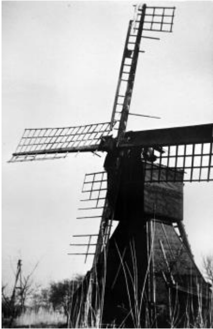
Kokerwindmühle Leegmoor 1958