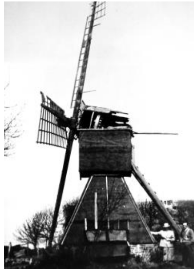
Kokerwindmühle Leegmoor 1958