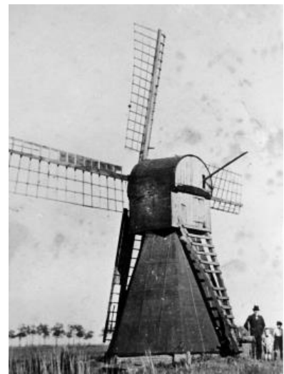
Kokerwindmühle in Leegmoor, 1939

ist Borke, Eichenrinde, zum Siehe auch Emden