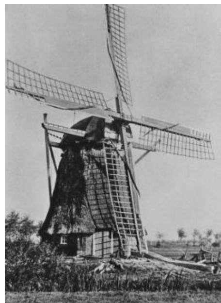
Wassermühle zu Ochtelbur

Die Mühle Nr. 12, Jann Rewerts, gehörte zu einem Hof in Riepe. Sie entwässerte in den Wegschott-Graben. Eine Besonderheit an dieser Mühle war, dass sie auch einen Teil der Ländereien, die auf der Nordseite des Wegschottgrabens lagen, mit entwässerte. Um dies zu