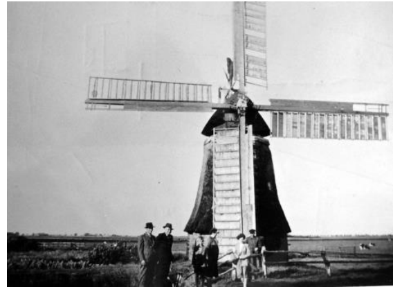
Im Riepster Hammrich 1957

Der im August dieses Jahres gestorbene Mühlenkenner Gerd Saathoff nennt für das große Meer einen Wasserschöpfmühlenbestand von über 250. Amtmann C. H. Stürenburg bemerkt in seiner 1755 verfassten Beschreibung des Amtes Aurich über die Vogtei Riepe: „Seit der Königlichen Regierung sind sowohl in dem Riepster Hammrich, als auch selbst in der Riepe, verschiedene Wassermühlen gebauet worden, zur besseren Abwässerung und Austrocknung der niedrigen Ländereien.“ Aus Stürenburgs Hinweis könnte gefolgert werden, dass in der Vogtei Riepe vor dem Auftreten Preußens (1744)