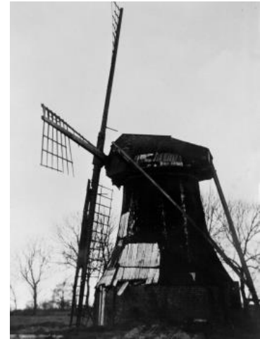
Wasserschöpfungsmühle Rientje Buhr, Abbruch 1965. Die Mühle stand 300 m von der Kokerwindmühle Leegmoor entfernt. Foto: 1958